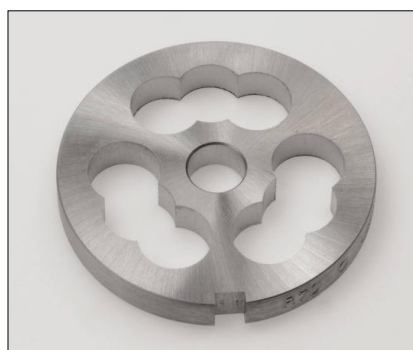
Vorschneider R70 No.0 gerade Bohrung, inox