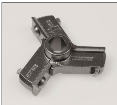
Messer SO/R70, 3 Flügel, inox