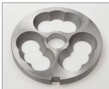
Vorschneider FW200 No.0 konische Bohrung, inox