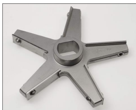
Messer FW200, 5 Flügel, inox